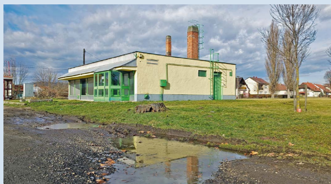
Az élelmiszerláncot képviselő cég már meg is vásárolta a területet

– Javítanunk kellett a tervezett költségvetésünket, hiszen az energiaárak elszabadulása, a történelminek nevezhető infláció és az euróárfolyam nemcsak a lakosság életét nehezíti meg, hanem bizony a mi számításainkat is felborította. Számunkra fontos az intézményeink zavartalan működésének fenntartása, ezért a Zalaszentgrót és a környező települések társulása által fenntartott Zalaszentgróti Szociális, Család- és Gyermekjóléti Központ, a család- és gyermekjóléti szolgálat, továbbá a házi segítségnyújtás működtetéséhez hozzá kellett járulnunk. Emellett volt egy megállapodásunk a Roma Nemzetiségi Önkormányzattal, valamint döntöttünk a hulladékgyűjtéssel kapcsolatos szerződésekről is. Ami talán a legérdekesebb, az a helyi építési szabályzat módosítása. Ennek keretén belül többek között papírra vetettük a Tüskeszenter és Túrje közötti