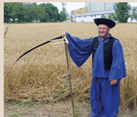
A kézi aratónapon a szervezők hangsúlyt fektettek a korabeli kellékek, öltözékek bemutatására is