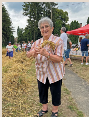
Vali néni bemutatta, hogyan kell kötelet fonni a gabonaszárból

A rendezvény a tüskeszentpéteri malom és a Szent Péter és Pál-templom szomszédságában található búzaföld megáldásával kezdődött, ezt követte a kézi aratás. A marokszedő lányok kévékbe gyűjtötték a levágott gabonát, ezeket búzaszálakból font kötelekkel összekötötték, majd a sorban keresztbe tették. A hagyományos aratást zörgőkocsis kévehordás, cséphadarás és kaszakalapálás követte. A program, amelyre a sikere miatt sokáig emlékezni fognak, kulturális műsorokkal folytatódott, és bál zenével fejeződött be.