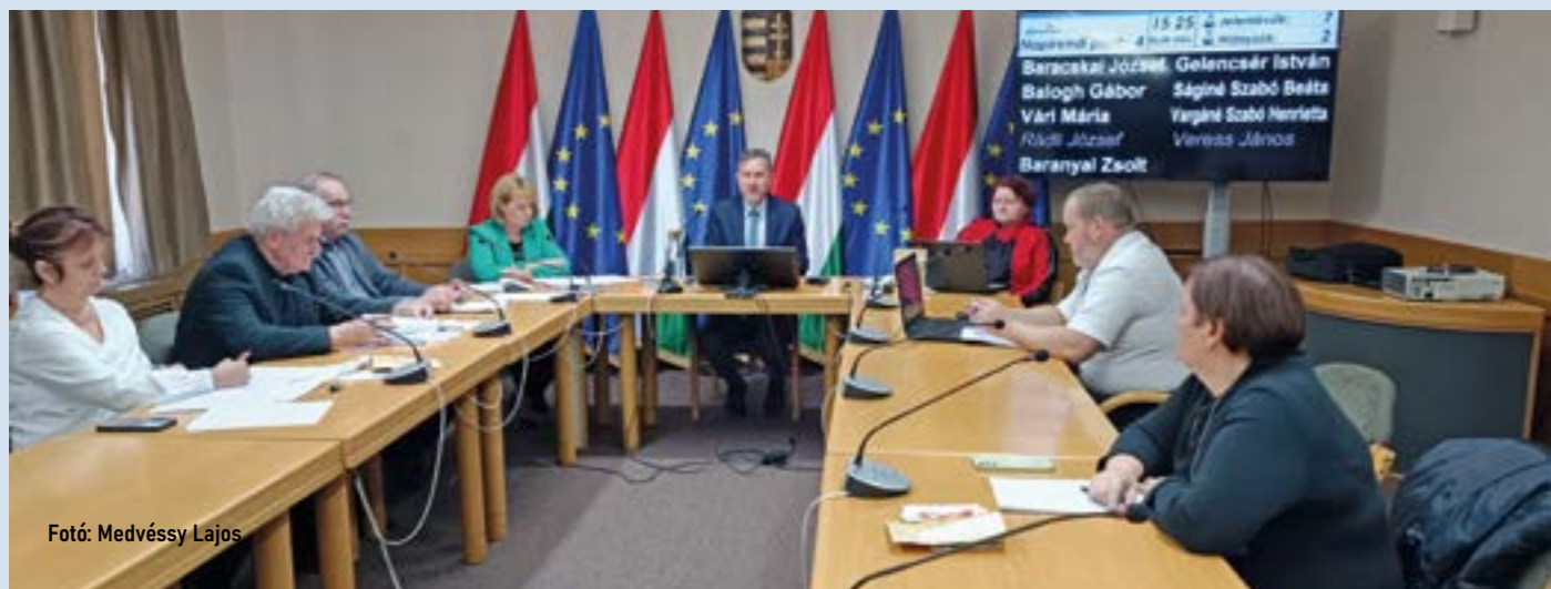
Fotó: Medvéssy Lajos