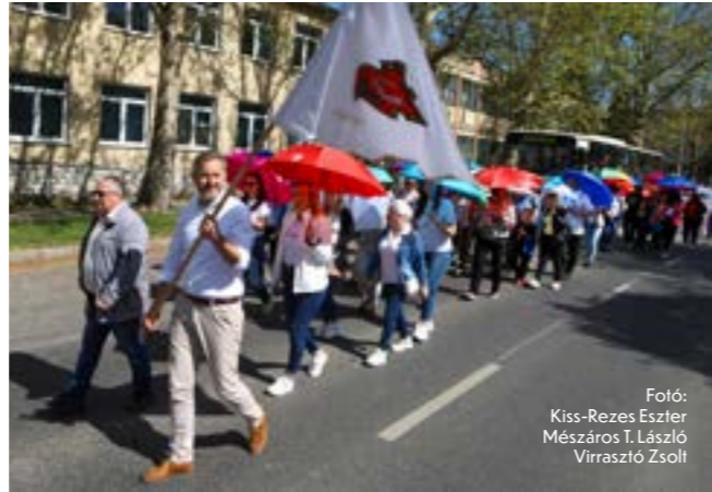
Fotó: Kiss-Rezes Eszter Mészáros T. László Virrasztó Zsolt

A Limonádé lányok rock&roll fellépése után Malek Andrea és Schneider Zoltán gitáros produkciója következett. Az előadás meghitt hangulatot teremtett, de gyerekek számára újra felpörgött az este: a programot végül a tini disco zárta, ahol a legfiatalabbak kedvenc zenéikre táncolhattak és közös élményekkel fejezhették be az ünnepi napot.