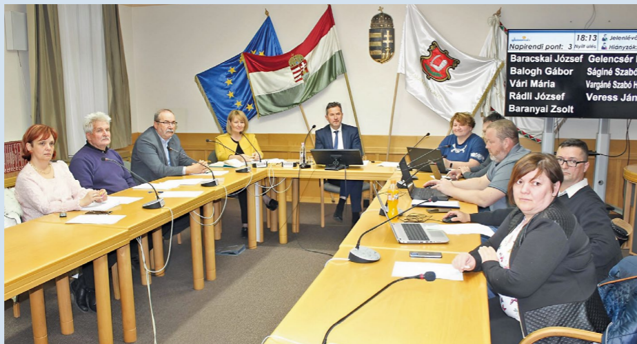
A több, mint két órás ülésen huszonnégy napirendi pont szerepelt, köztük két szervezet beszámolója is