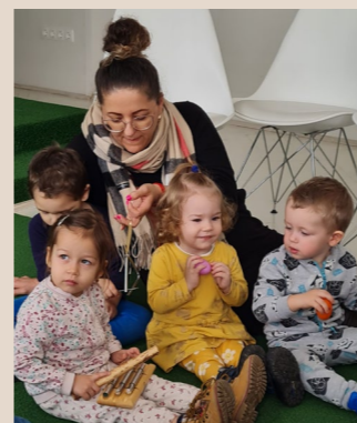
Gyerekekkel a hangbölcsőben