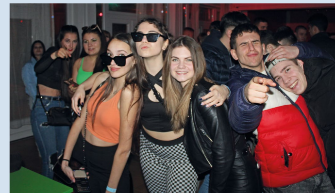
A zalaszentgróti buliba a közönség többsége vidékről érkezett

a referenciák miatt szerveztük meg. Sajnos több külső tényező miatt látogatottság szempontjából nem úgy sikerültek a rendezvények, mint amire számítottunk, de a két partyt így is több, mint háromszázan voltunk. A jövőre nézve nagyon sok terünk van, a közeljövőben több rendezvényünk is lesz, április 22-én pedig közös szervezésben fogunk lebonyolítani egy 13 sztárfellépős estét a Tapolcai Sportcsarnokban. Nem árulok el titkot, ha azt mondom, a budapesti éjszaka is célpont. Kita-